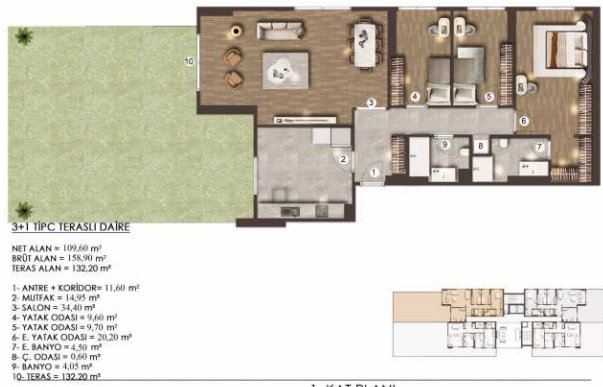
1. KAT PLANI