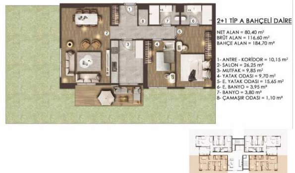
ZEMİN KAT PLANI