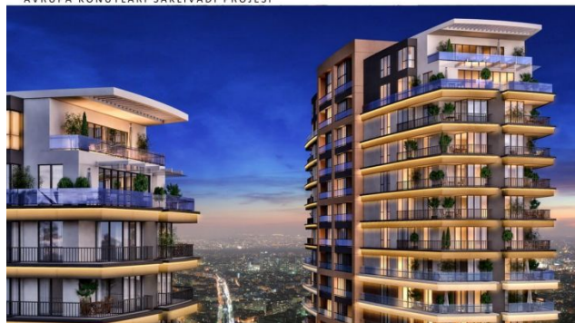
AVRUPA KONUTLARI SAKLIVADI PROJESI