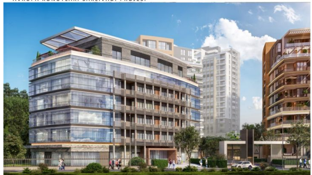
AVRUPA KONUTLARI SAKLIVADI PROJESI