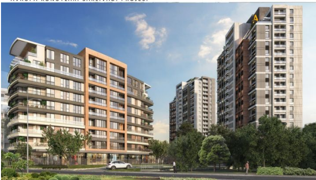
AVRUPA KONUTLARI SAKLIVADI PROJESI