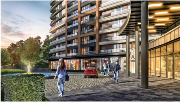
AVRUPA KONUTLARI SAKLIVADI PROJESI