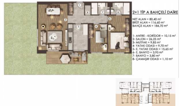
ZEMİN KAT PLANI