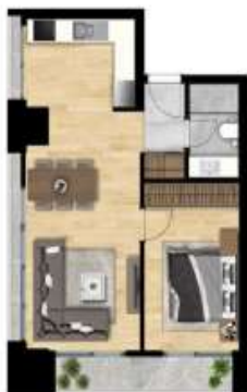
1+1 TİP 5 A BLOK