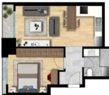
1+1 TİP 1 A BLOK