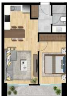
1+1 TİP 2 A BLOK