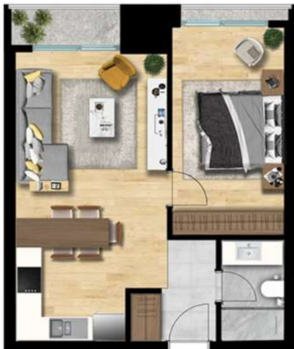
1+1 TİP 3 A BLOK