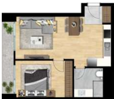
1+1 TİP 4 A BLOK