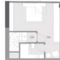
1+1 D KAT